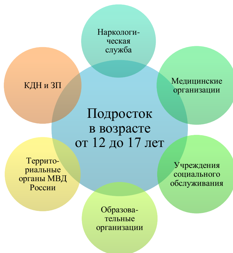
Рисунок 2. Межведомственное взаимодействие в сфере профилактики употребления ПАВ среди подростков

Субъектами профилактики наркологических заболеваний в возрастной группе 12-17 лет на федеральном и региональном уровне также являются лидеры превенции (рис 2). Это наркологическая служба и другие медицинские учреждения, учреждения образования и МВД. Ниже представлен пример распределения задач субъектов профилактики по городу Москве (табл. 4).