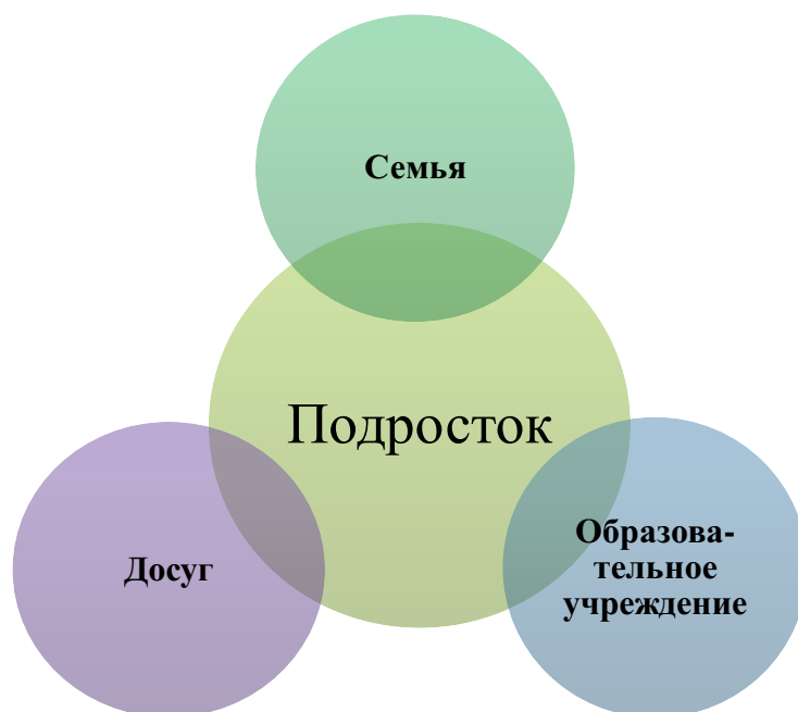
Рисунок 1. Современная концепция профилактики употребления ПАВ среди подростков

2. Формирование ресурсов семьи, помогающих воспитанию у подростков законопослушного, успешного и ответственного поведения, а также ресурсов семьи, обеспечивающих поддержку ребенку, начавшему употреблять наркотики, сдерживающих его разрыв с семьей и помогающих ему на стадии социально - медицинской реабилитации при прекращении приема наркотиков;